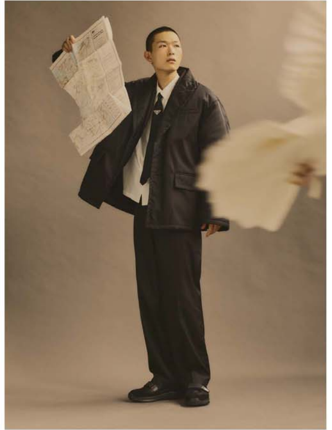
深灰色尼龙外套 深灰色尼龙短外套 白色衬衣 黑色领带 黑色裤子 黑色皮鞋