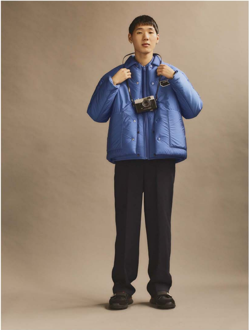
尼龙夹棉外套 羊毛长裤 皮鞋