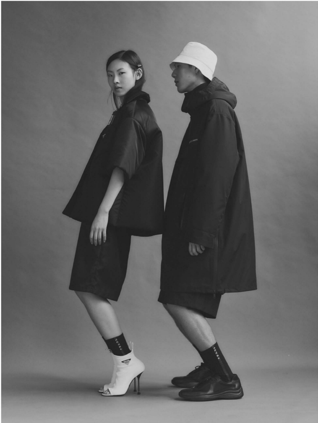
从左到右 尼龙夹棉外套 尼龙裙子 棉质袜子 高跟鞋 尼龙夹棉连帽长外套 短裤 棉质袜子 皮质运动鞋 尼龙帽子