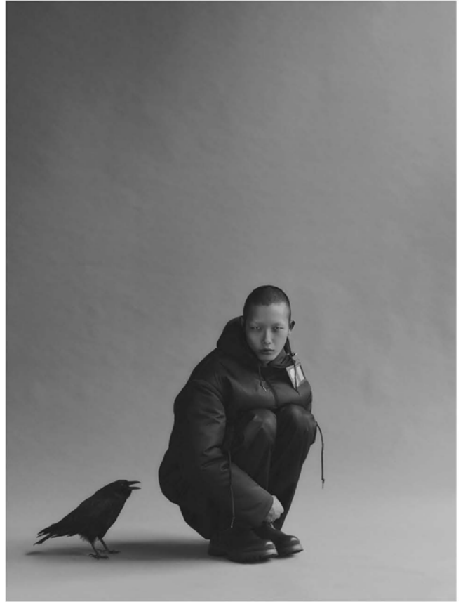
黑色尼龙套头上衣 黑色尼龙裙子 黑色尼龙长裤 皮鞋