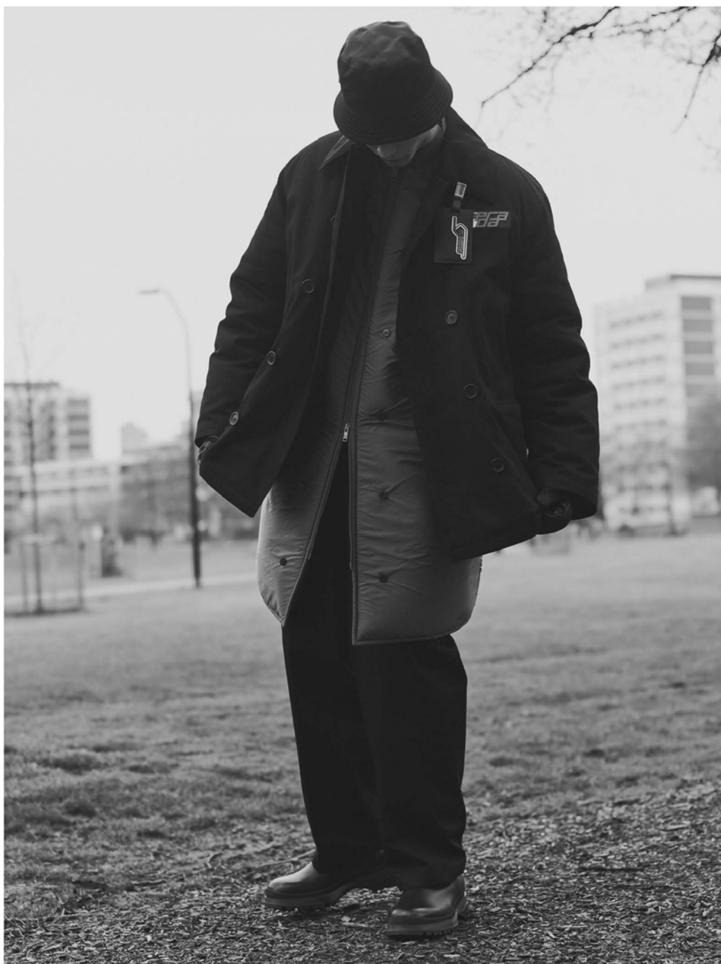
黑色尼龙短外套 灰色尼龙拉链长外套 黑色长裤 皮鞋 尼龙帽子