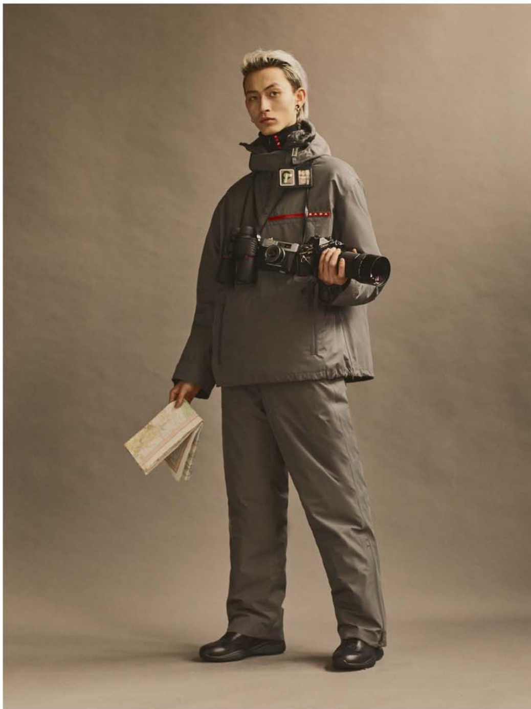
尼龙套头上衣 尼龙长裤 皮鞋